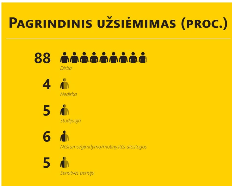
Diagrama 3. Pagrindinis respondentų užsiėmimas (proc., N=424)

Dauguma (88 proc.) tyrimo dalyvių šiuo metu yra dirbantys. Iš jų nevyriausybiniams organizacijoms, ieškančioms savanorių, tikslinė grupė galėtų būti tie, kurių darbas rutininis, nuobodus, nenešantis aktyvaus pokyčio. Tačiau šios grupės atstovai veikiausiai imtųsi savanoriškai veiklai tų užduočių, kurios skiriasi nuo jų kasdienio, rutininio darbo.