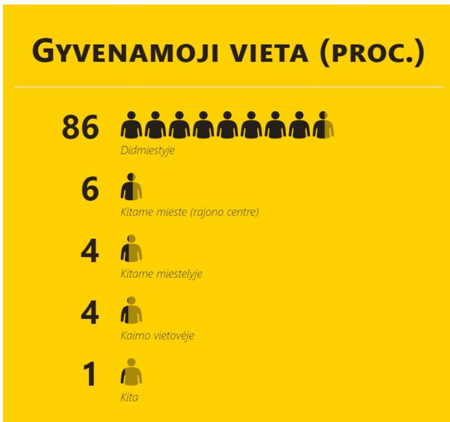
Diagrama 2. Respondentų gyvenamoji vieta (proc., N=424)

Daugiausia apklaustųjų gyvena didmiesčiuose, 15% gyvena kitur – rajono centre (6 proc.), kitame miestelyje (4 proc.) ar kaimo vietovėje (4 proc.). Lyginant su tyrimais, analizuojančiais savanorystę regionuose, galima pastebėti, kad, pvz., Jungtinėse Amerikos Valstijose tradiciškai aukšti savanorių skaičiai yra fiksuojami nedidelėse, kaimiškose vietovėse bei priemiesčiuose (30 proc.), ir sąlyginai mažesni – dideliuose miestuose (23 proc.). Tačiau Marylando Universiteto mokslininkų 2018 metais atliktas tyrimas parodė ženklų kritimą savanoriaujančių asmenų skaičiaus kaimiškose vietovėse ir priemiesčiuose, pasiekusį rekordines 25 proc. žemumas, tuo tarpu kai didžiuosiuose miestuose savanoriaujančių asmenų skaičius išliko stabilus.