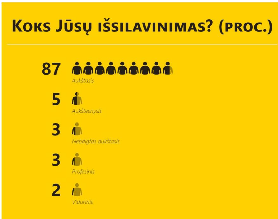
Diagrama 4. Respondentų išsilavinimas (proc., N=424)

Dauguma tyrimo dalyvių turi aukštąjį išsilavinimą. Savanorystės praktikų tyrimai rodo, kad dažniau savanoriauja aukšto išsilavinimo gyventojai, tokių dauguma ir buvo šio tyrimo dalyviai. 2017 metais JAV Statistinių tyrimų departamento duomenimis, dažniausiai savanoriavo aukštesnįjį išsilavinimą turintys asmenys (tokių buvo 56,5 proc.), rečiausiai – vidurinio išsilavinimo neturintys žmonės (9,1 proc.).