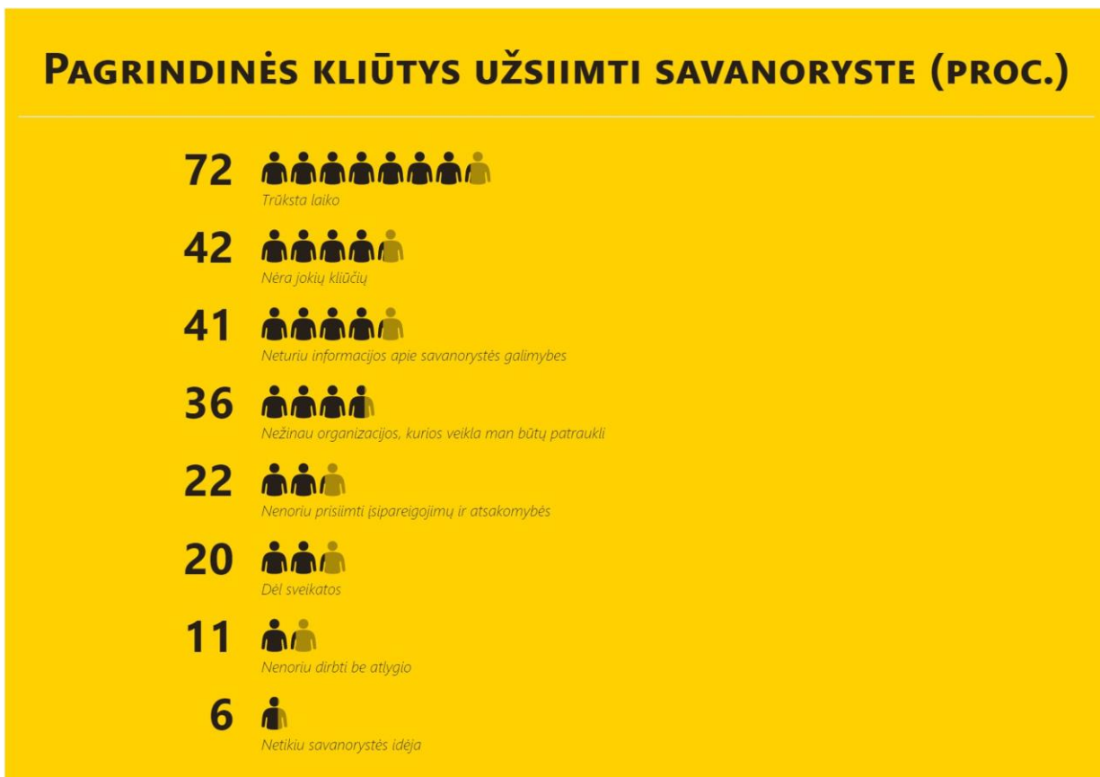
Diagrama 9. Pagrindinės kliūtys užsiimti savanoryste (proc., N=424)

*viršija 100 proc., nes galėjo rinktis kelis variantus.