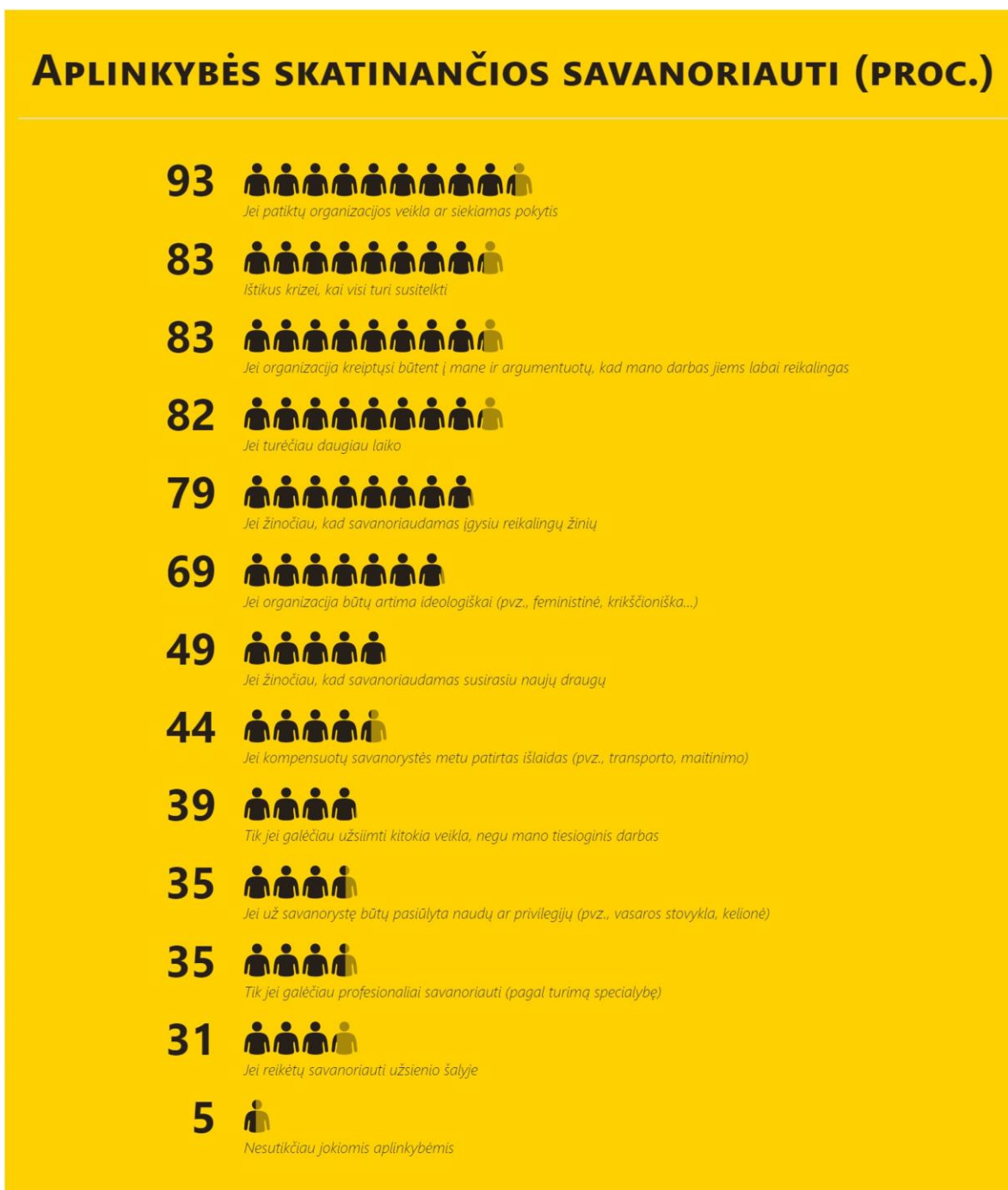
Diagrama 7. Savanoriauti skatinančios aplinkybės (proc., N=424)

Daugumos (93 proc.) respondentų įsitikinimu, pagrindinė savanoriauti skatinanti aplinkybė yra simpatija organizacijos veiklai ar jos siekiamam pokyčiui. Vadinas, organizacijos, dirbančios vaikų, negalią turinčių ar pagyvenusių asmenų globos ar kitose, visuotinai pripažintose socialiai jautriose srityse,